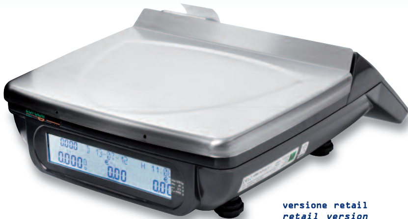
versione retail retail version