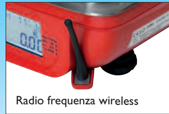
Radio frequenza wireless