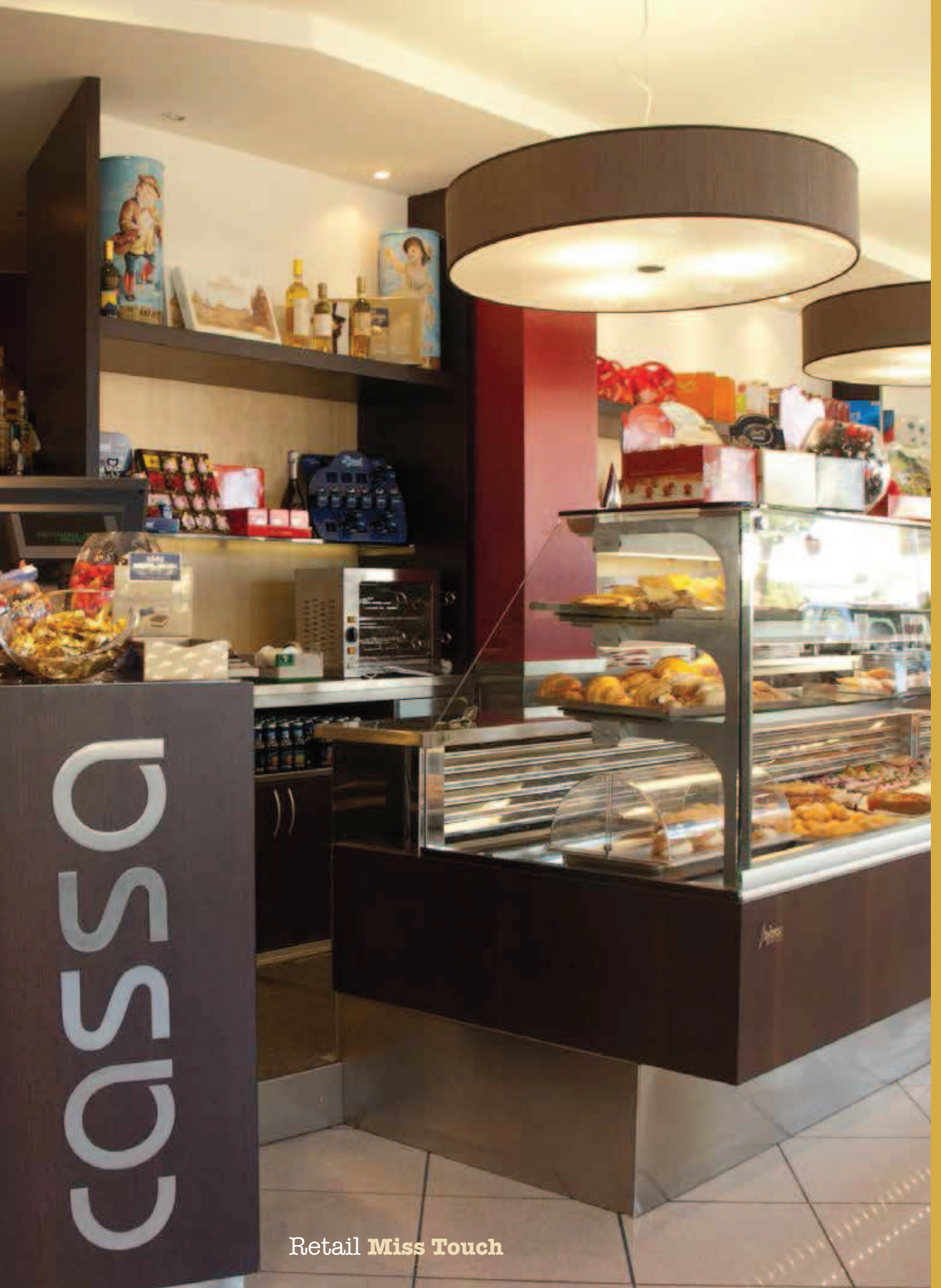
Retail Miss Touch